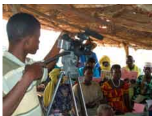
Tournage d'un film par le CEMECA

Se serrer la main, creuser la terre, caresser un chien, aller aux toilettes, partager un plat... nombreux sont les gestes quotidiens