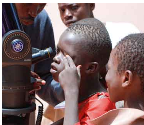
Observation du soleil