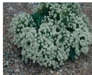
Chou marin, à Criel

Ces habitats abritent pas moins d'une vingtaine d'espèces animales et végétales inscrites à l'annexe II de la Directive Habitat et à l'annexe I de la Directive Oiseaux.