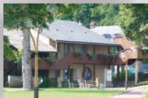
Musée de la Marine de Seine

18h - 22h ♦ Visite libre des collections permanentes (13 salles et visionnage de 2 films) et accès à l'exposition temporaire sur les photographies des Bouches de la Seine.