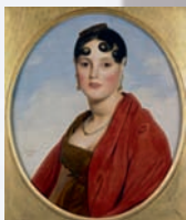
Jean-Auguste-Dominique Ingres, Portrait de Madame Aymon, dite «La Belle Zélie», 1806

19h30 ♦ Visite exposition "Darren Almond". Première monographie de l'artiste en France, cette exposition sur l'artiste britannique Darren Almond confronte un ensemble de ses œuvres réalisées entre 2000 et 2010. Fasciné par la question du temps et de sa représentation, Darren Almond développe depuis le début des années 1990 un travail composite qui mêle photographies de paysages, artefacts industriels et films.