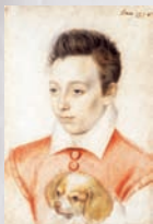
Portrait présumé de Charles IX enfant attribué à Pierre Desmontier

16h ♦ Loïc Josse, pour son livre Terre-Neuvas, Les derniers voiliers morutiers de Saint - Malo et Cancale .