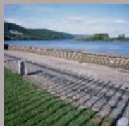
Musée Victor Hugo

17h et 20h ♦ Spectacle musical avec Catherine Postic et Nicolas Lavenu : "La leçon de piano des demoiselles Hugo". Inscription nécessaire au 02 35 56 78 31.