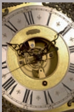
Cadran régulateur

musée et de l'exposition "Théophile Gautier et Victor Hugo: même combat?".