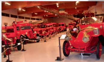
Salle d'exposition : les véhicules