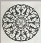
Imposte circulaire monogrammé GBM, vers 1700

19h ♦ Les chefs-d'œuvre et l'actualité du musée. Visite commentée. De l'enseignement à L'Arbre sec à la crèche-lanterne en passant par les bijoux en fonte de Berlin, la visite sera l'occasion de (ré)découvrir les joyaux de la collection initiée par Henri Le Secq des Tournelles ainsi que les nouveautés du musée : rénovation des vitrines des poids et mesures, exposition des nouvelles acquisitions.