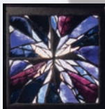
Vitrail croix d'Isaïe de Henri Guérin, 1978, dalle de verre et béton

19h - 22h ♦ Exposition-rétrospective Isabelle MONOD. L'exposition temporaire présente une rétrospective de l'artiste Isabelle Monod. À travers une sélection de 120 pièces, créées entre 1976 et 2011, l'exposition propose de découvrir le parcours d'une artiste issue du Renouveau du verre français, qui a su faire évoluer son œuvre vers la sculpture de verre.